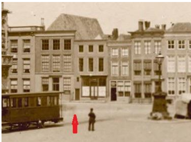
Links: ZA, Zelandia Illustrata 295-401, kopergravure uit 1859-1862! (Eigendom KZGW, fragment). Boven: ZA, Zelandia Illustrata 295-2443, foto ca. 1900. (Eigendom KZGW, fragment). Op beide afbeeldingen is C13 duidelijk te zien.

Bron 01: Zeelands Cronijk Almanach , Middelburg 1786, 1020-1021.